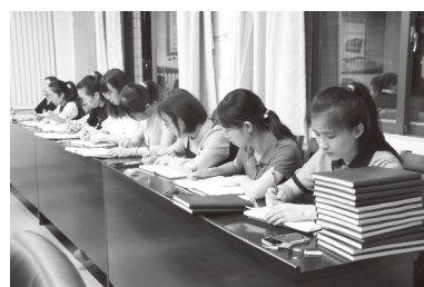
老师们用《党的二十大精神学习笔记》记录会议内容